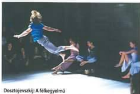
Dosztojevszkij: A félkegyelmű